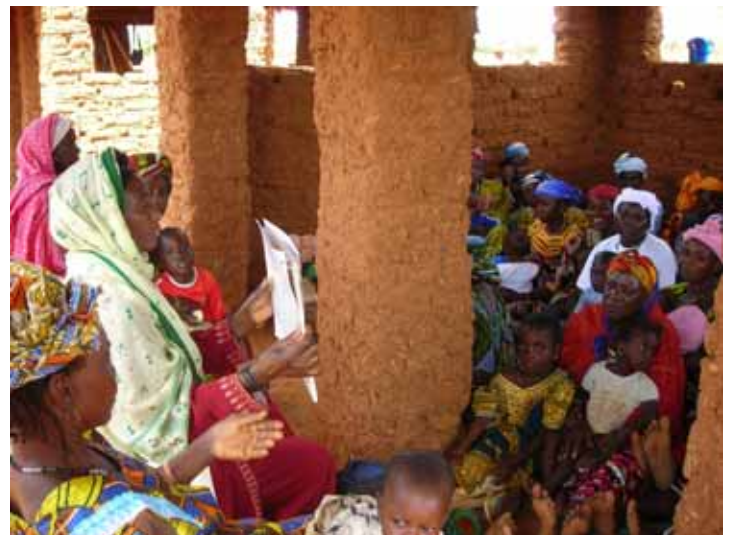
タボエ村での研修風景 「人前で講師をするのはなかなか恥ずかしいわ...」と言いつつもいざ始まると堂々とした話しぶり。お母さん方もなんと全員出席。

研修のあとは学んだことが家庭できちんと実践できているか、トレーニンググループによる家庭訪問も始まっています。家庭訪問時には、家の周囲、部屋の中、炊事場、トイレ、家畜小屋などが