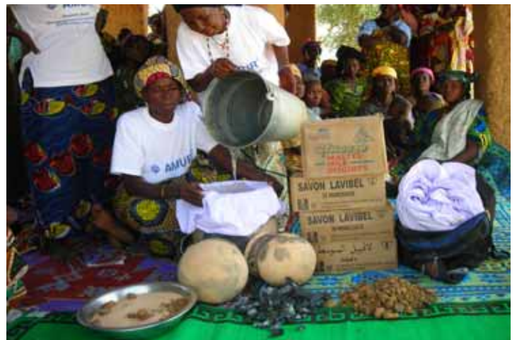
研修では汚れた水をろ過してきれいな水にする方法も実演。