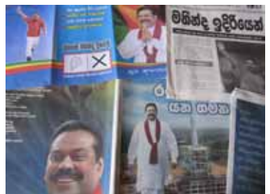
選挙が終わって、大統領決定