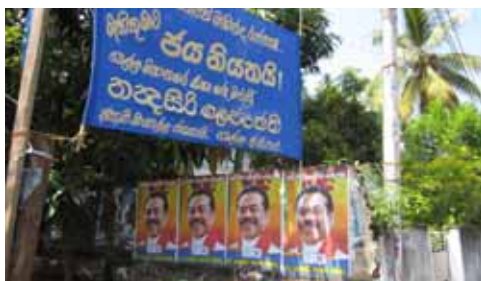
街のいたるところに候補者のポスター