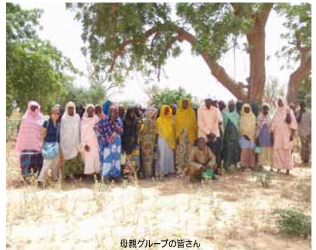
母親グループの皆さん